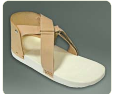
Artikelcode: NFL-ULZ-L of R + maat