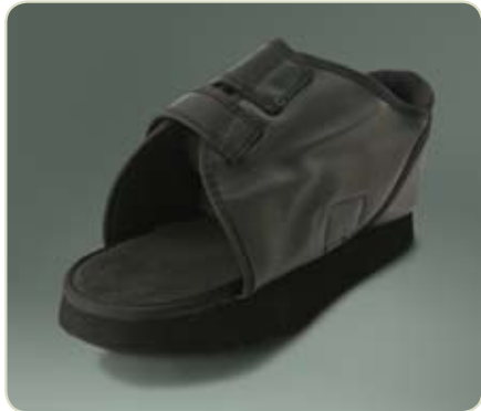
Artikelcode: NIL-POS-TA-013-L of R + maat