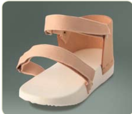
Artikelcode: NFL-SL-L of R + maat