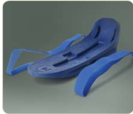
Artikelcode: NFL-GO + maat