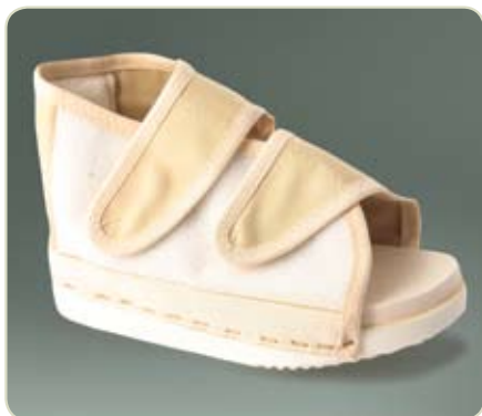
Artikelcode: NFL-SL-POS-L of R + maat